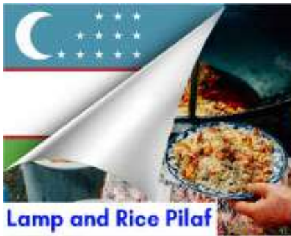
Lamp and Rice Pilaf