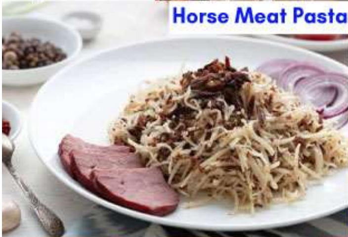
Horse Meat Pasta