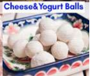
Cheese & Yogurt Balls