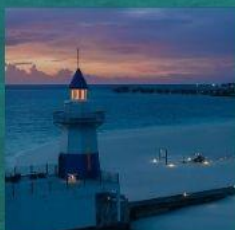
Light House Restaurant