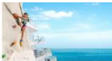
ROCK THE WALL