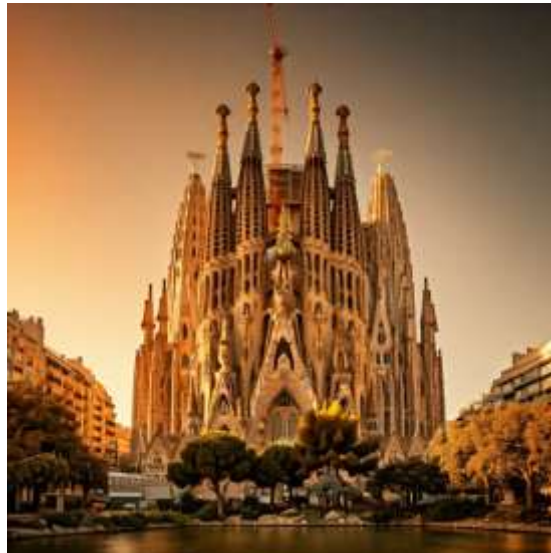
Sagrada Família barcelona spain

มหาวิหารซากราดาแฟมิลี (Sagrada Família): สัญลักษณ์ของบาร์เซโลนาและผลงานชิ้นเอกของเกาดีที่ยังสร้างไม่เสร็จ แต่ก็สวยงามตระการตาด้วยสถาปัตยกรรมที่แปลกตาและรายละเอียดที่ประณีต