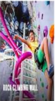
ROCK CLIMBING WALL