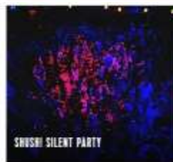
SHUSHI SILENT PARTY