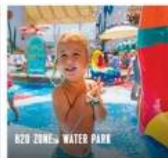
B20 ZONES WATER PARK