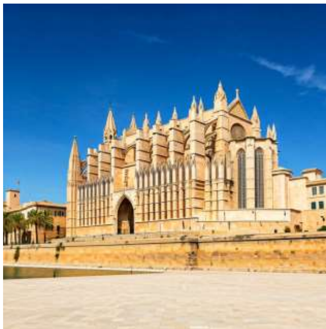
Palma de Mallorca:

Catedral de Mallorca: มหาวิหารปาล์มา เด มาจอร์กา สถาปัตยกรรมโกธิคที่สวยงามตระการตา ภายในมีกระจกสีสวยงามและโคมไฟระย้าขนาดใหญ่