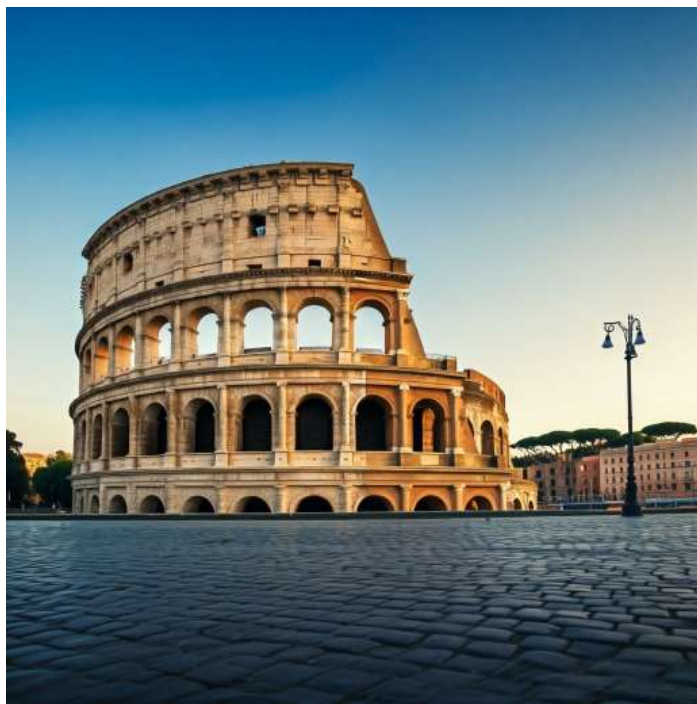
โคลอสเซียม กรุงโรม เริ่มสร้างขึ้นในสมัย จักรพรรดิเวสเปเซียนแห่งจักรวรรดิโรมัน

ซีวีตาเวกเกีย (Civitavecchia) เมืองท่าสำคัญของอิตาลี ตั้งอยู่บนชายฝั่งทะเลติร์เรเนียน ใกล้กรุงโรม ด้วยความเป็นเมืองท่าที่คึกคัก ทำให้ซีวีตาเวกเกียมีเสน่ห์ที่ผสมผสานระหว่างความเก่าแก่ของอาคารสถาปัตยกรรม และความทันสมัยของท่าเรือ