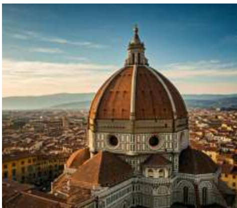
Duomo di Firenze

Piazza della Signoria: จตุรัสกลางเมืองที่รายล้อมไปด้วยอาคารสำคัญต่างๆ