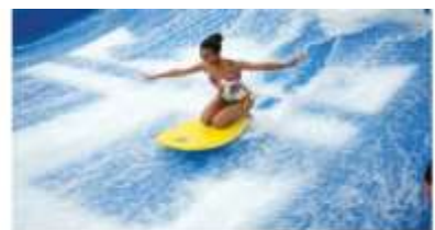
TAME THE TIDES