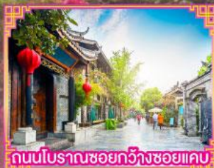
ถนนโบราณชอยกวางฮวยแคบ