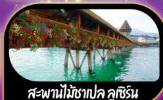
สะพานไม้ฆาปค ลูซิริน