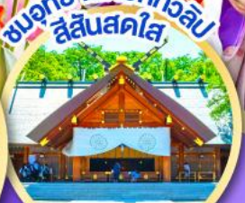
ชมอุทยานดอกทิวลิป สีแสนสดใส