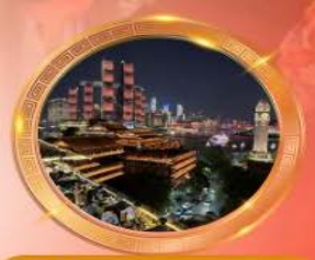
มือค้ำร้านอาหารวิวหลักล้าน