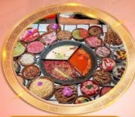
บุฟเฟต์หม้อไฟลงชิง