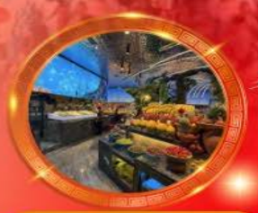
มือพิเศษ บุฟเฟต์นานาชาติ