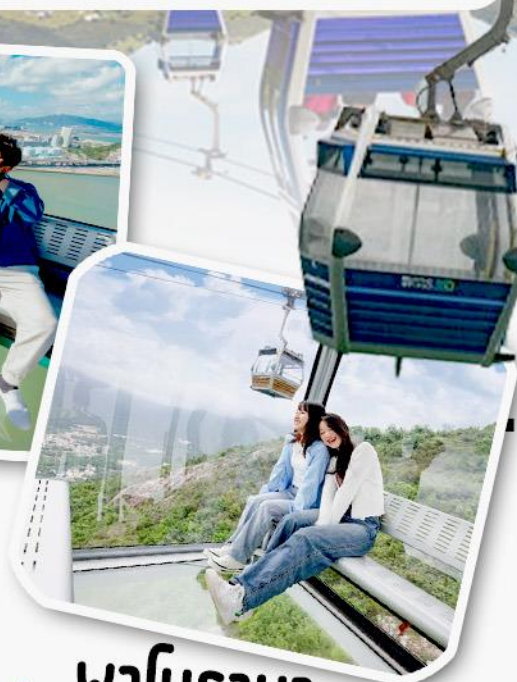
พานิราม่า