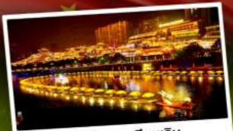
เมืองโบราณเซียนเ็น