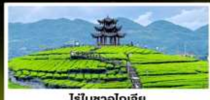
ไร่ชาอูโตเจีย