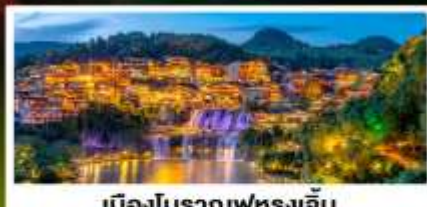
เมืองโบราณฟุทงเจิน