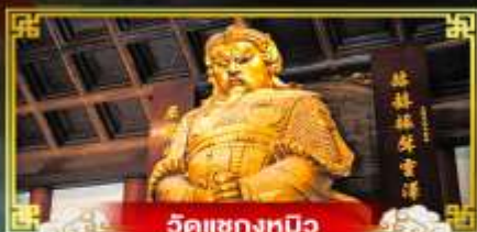
วัดเขangkมัว