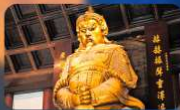
วัดเซ่งกทหมีว