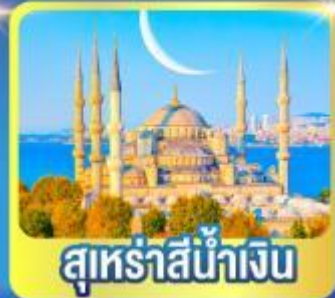
สุหรัสีน้ำเงิน