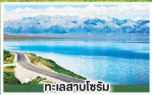
ทะเลสาบโซรัม