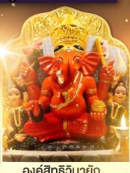
องค์สิทธีวินายัก