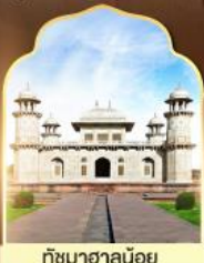
ทัชมาฮาลน้อย