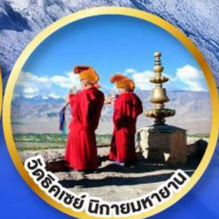
วัดริคเซย์ ปิกายมหายาน