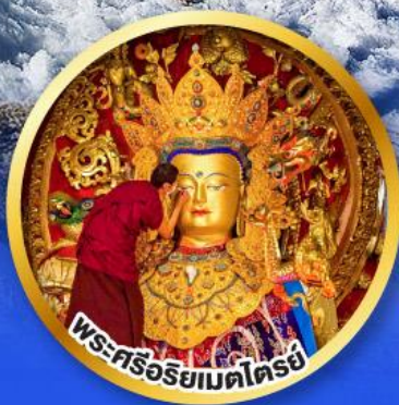
พระศรีอริยเมตไตรย์