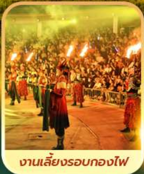
ງານເລີຍຮອບກອງໄຟ