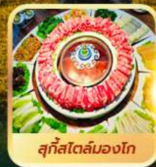
ສຸກິສໂຕລິມອງໂກ