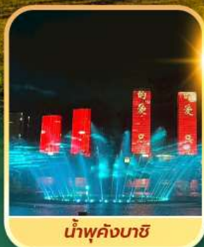
ນ້ຳພຸດິງບາຊີ