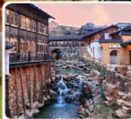
เมืองโบราณเหยahu