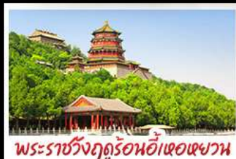
พระราชวังฤดูร้อนอ้าเฮอเฉาหวาน

ท่าแพงเมืองจินค่านจวียงกวน - พระราชวังฤดูร้อนอ้าหอยวน สวนจิ่งอัน - วัดลามะ - โมเดลร้านช้อปปิ้ง - โรงแรม 4 ดาว มือพิเศษ เปิดปีกกึ่ง สุกิมองโกล MICHELIN GUIDE ร้าน TAO TAO JU