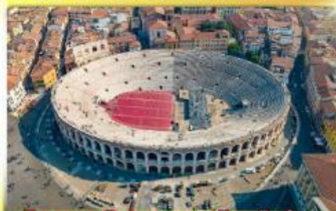
โรงละครโรมันกลางจัหวโรม่า