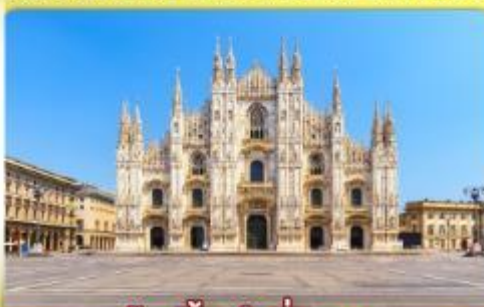
ซอปป์ิงจู่ที่มีลาน