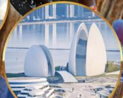
โรงแรมหรูไฮมุก