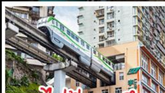
รถไฟไฟทะเลลู่ติก