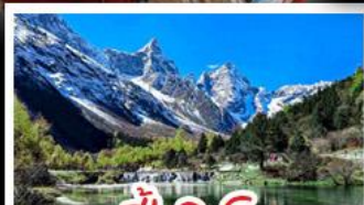
ปี้เฉิงโกว