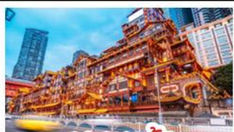
เฉิงเฉิงเฉิง

อุทยานหลุมบ่อฟ้า - อุทยานเขานางฟ้า หงหยาดัง - นังรถไฟทะเลลู่ติก - อุทยานสีดรุณี ปี้เฉิงโกว - สะพานหนานเฉียว