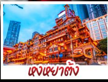
แดนเซาตัง