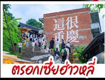
ตรอกซี่ย่าวหลี่