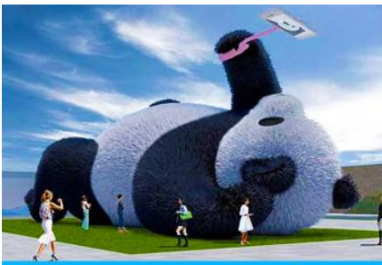
ตุ๊กตาแพนด้าเซลฟี

เที่ยง รับประทานอาหารกลางวัน ณ ร้านอาหารพื้นเมือง (5) หลังอาหารนำท่านเดินทางสู่ เมืองตูเจียงเยียน 都江堰 (ระยะทาง 234 กม. ใช้เวลาเดินทางราว 4 ชั่วโมง) ระหว่างเดินทางท่านสามารถชมทัศนียภาพธรรมชาติอันงดงามของสองข้างถนนขณะที่รถแล่นผ่าน ที่มีทั้งภูเขาหิมะสูง หุบเขา ธารน้ำ และทุ่งหญ้าบนที่ราบสูง หรือพักผ่อนตามอัธยาศัยบนรถระหว่างเดินทาง