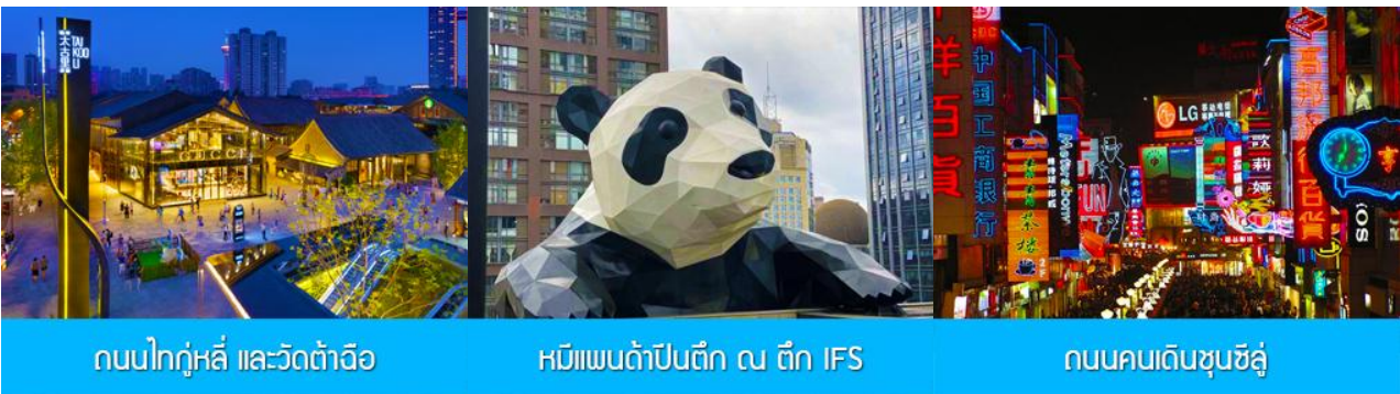
ถนนไท่กู่หลี่ และวัดต้าเจี๊อ