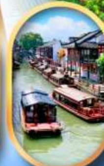
ถนนชานกิงเจีย