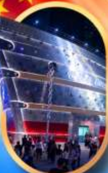
เรือคองคอง