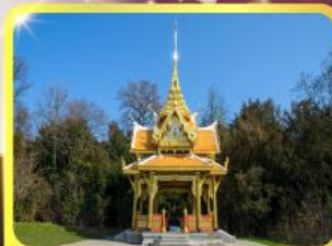
ศาลาไทยไชยานท์