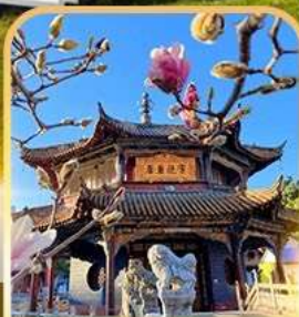
ວັດຫຍວນທງ