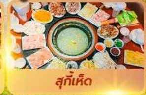
ສຸກິ່ເຫິດ