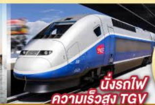
นั่งรถไฟความเร็วสูง TGV