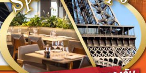
รับประทานอาหารกลางวันบนหอไอเฟล