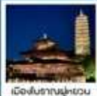
หมู่บ้านเหมียนฮวาฮวาน