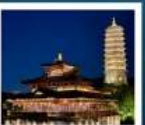
เมืองโบราณฝูหยวน

เมืองโบราณฝูหยวน / ภูเขาหินัวส่วชาน (รวมรถกอล์ฟ) ห้างสรรพสินค้าเต๋อจี้ / วัดจีหมิง / ทะเลสาบเซวียนอู่ ถนนอุ๋งต๋าเต๋า / อุ้ชีหมู่บ้านเหมียนฮวาวาน / เซาหุซิว เชียงใหม่ ทัศนิก ไนท์ / ถนนนานกิง / Tian An 1,000 Trees North Bund Green Land / Florentia Village Outlet