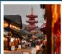
หมู่บ้านเหมียนฮวาวาน