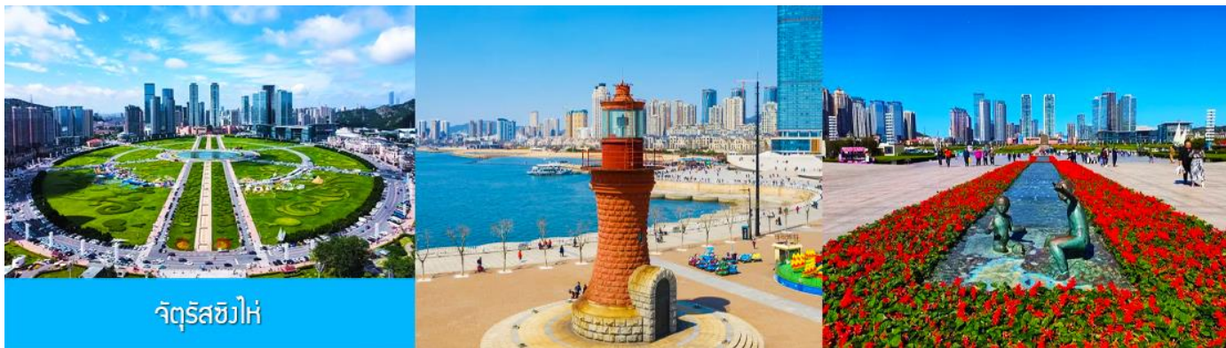
จัตุรัส星海

นำท่านเที่ยวชม จัตุรัส星海 星海广场 เป็นจัตุรัสขนาดใหญ่เป็นแลนด์มาร์คสำคัญของเมืองต้าเหลียน สร้างขึ้นเพื่อเฉลิมฉลองในโอกาสที่รัฐบาลอังกฤษคืนเกาะฮ่องกงในให้จีนในปี ค.ศ. 1997 ตั้งอยู่ชายฝั่งทะเลในเมืองต้าเหลียน เป็นจัตุรัสใจกลางเมืองที่ใหญ่ที่สุดในโลกและเป็นแลนด์มาร์คของเมืองต้าเหลียน รายล้อมด้วยตึกระฟ้าที่ทันสมัย ภายในมีบ่อน้ำพุดนตรี ลานหญ้าขนาดใหญ่ และลานกว้างสำหรับจัดกิจกรรมกลางแจ้ง อาทิ เทศกาลเปียร์นานาชาติ การแข่งขันวิ่งมาราธอน งานแฟชั่นนานาชาติเมืองต้าเหลียน ฯลฯ