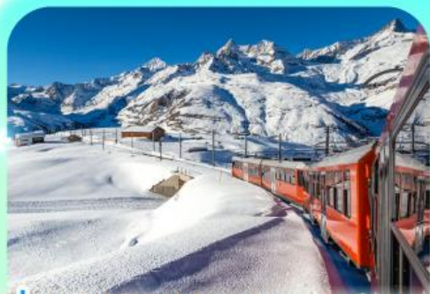
นั่งรถไฟสู่ยอดเขารอนเนอร์แอนด์