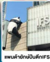
แพนด้ายักษ์ปีนตึกIFS