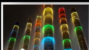
น้ำพุไม้ไผ่ตึกSKP