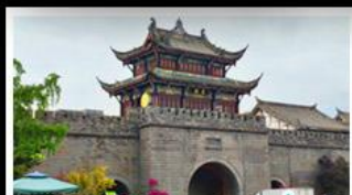
เมืองโบราณทวนเซี่ยน

ภูเขาสี่ดรุณี - อุทยานป่าผิงโกว - สะพานหมานเฉียว - ร้านหนังสือจงซูเก๋ - เมืองโบราณกวนเสียน จตุรัสหยางเทียนหวู่ - หมีแพนด้าเซอเฟี - ถนนโบราณชอยกวางชอยแคบ - ถนนคนเดินไท่กู๋หลี่ ถนนคนเดินซุนซี - ถนนโบราณจินหลี่ - แพนด้ายักษ์ปิ่นตึก - น้ำพุไม้ไผ่ตึกSKP - วัดต้าจื่อ