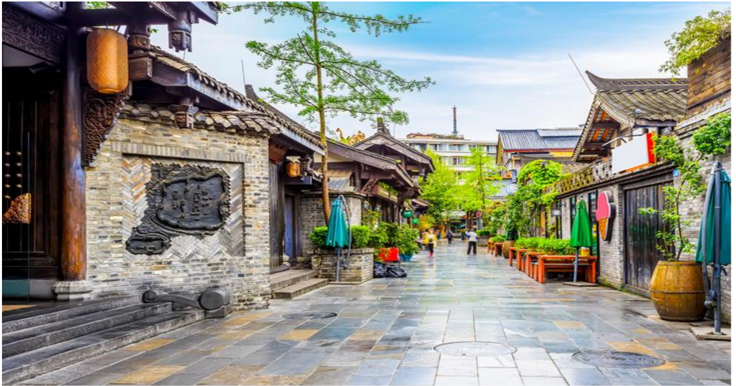
กลางวัน รับประทานอาหารกลางวัน ณ ภัตตาคาร (เมื่อที่ 11)

จากนั้นนำท่านเที่ยวชม ถนนโบราณชอยกว้างชอยแคบ + POP MART จัดว่ามีเสน่ห์ของความเป็นอาคาร ตกแต่งด้วยเรื่องราววิถีชีวิตการเป็นอยู่ของคนจีนเฉิงตูในสมัยโบราณ แต่ผสมความทันสมัยใส่เข้าไปได้อย่างลงตัว ถนนคนเดินมี 3 ซอย แต่ละซอยมีความยาวประมาณ 400 เมตร มีร้านค้าเล็กๆ ตั้งเรียงรายอยู่ในแต่ละซอยและตรอกให้เดินช้อปปิ้งเพลิน ทั้งร้านหนังสือ ร้านชา-กาแฟ บาร์ เสื้อผ้า ไปจนถึงร้านอาหารนานาชาติ รวมร้านค้าทุกซอยแล้วมีจำนวนหลายร้อยร้านค้า