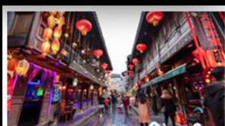
ถนนโบราณจินหลี่