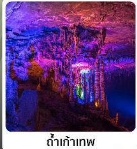
ຕໍ້າເຕົາທຸພ