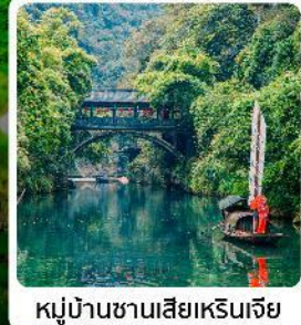
ສມຸ່ບ້ານຊານເສີຢາງເຣີນເຈີຢາງ