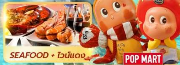
SEAFOOD + ไวน์แดง