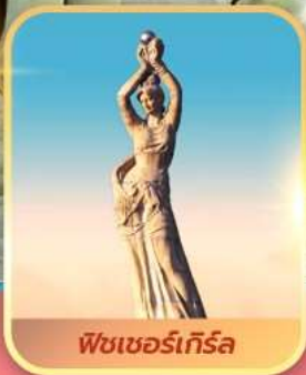
ฟิชเซอร์เกิร์ล