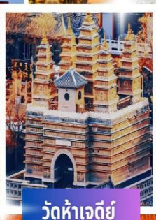
วัดห้าเจดีย์