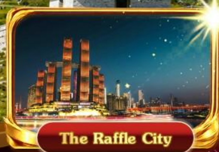
The Raffle City