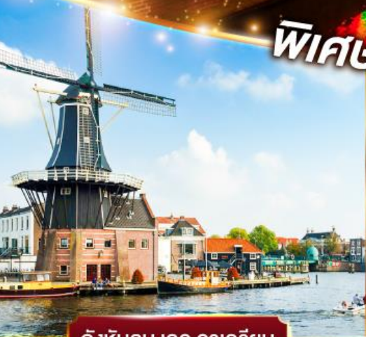
กังหันลม เดอ อาครีเยน