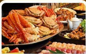
บุฟเฟ่ต์ชาบู+ชาปู 3 ชนิด