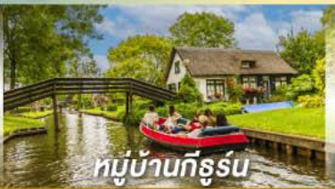
หมู่บ้านทีรูร์น