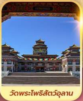
วัดพระโพธิสัตว์จุลาน