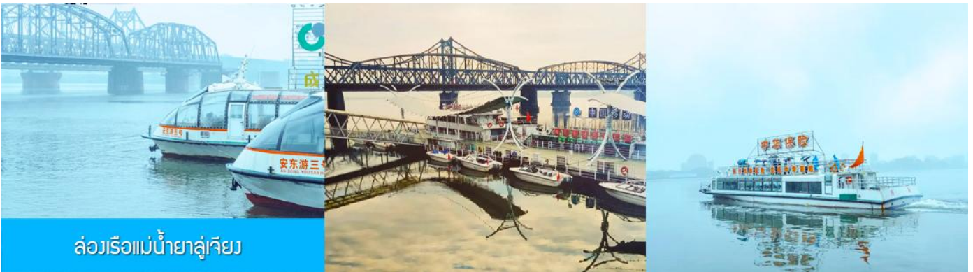
ล่องเรือแม่น้ำยาลูเจียง

หลังอาหารให้ท่านพักผ่อนตามอัชชาศัยในโรงแรม