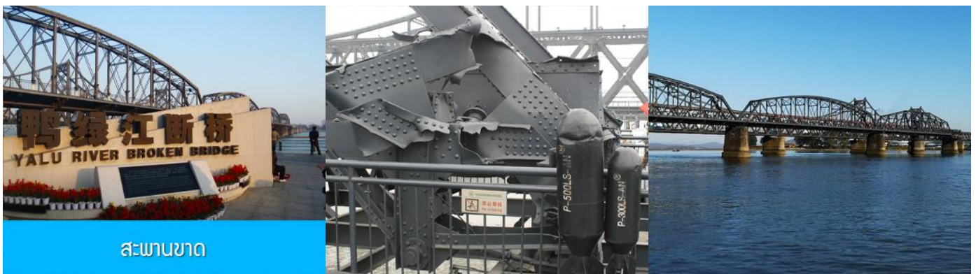
สะพานขาด