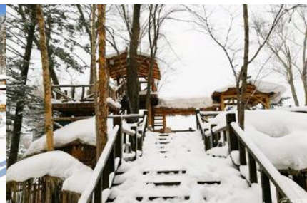
ระเบียงชมวิวปี้วูยซาน

วันที่สาม เมืองฮาร์บิน-สถานีรถไฟยาบูลี-รวมนั่งม้าลากเลื่อน- หมู่บ้านหิมะ Xue xiang China Snow Town - ระเบียงชมวิว เขาปี้วูยซาน- ชมแสงสียามราตรีหมู่บ้านหิมะ-ชมพลุไฟและขบวนพาเหรดระบำพื้นเมือง-นอนในหมู่บ้านหิมะ Xue xiang