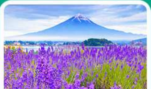
สวนโออิชิพาร์ค