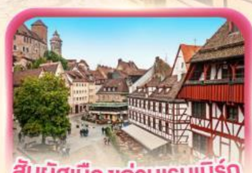
สัมผัสเมืองเก่าบูเรมเบิร์ก