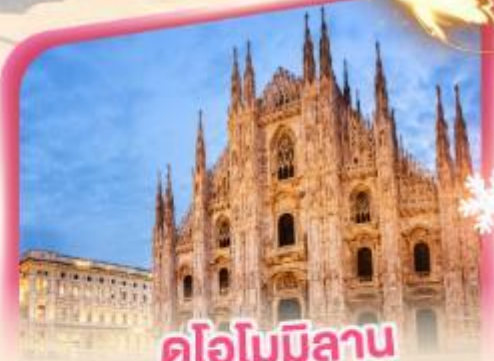
คูโอโมมิลา