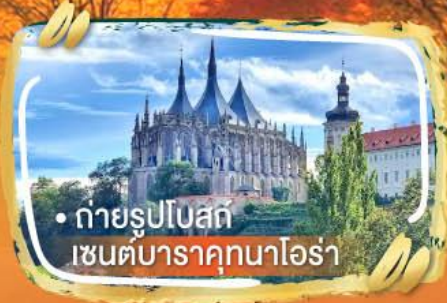
• ถ่ายรูปโบสถ์ เซนต์บาราคุกนาโอร่า

ไฮไลท์ในโปรแกรม • บราติสลาวา เมืองเล็กแต่น่ารักเกินต้าน • เบอร์โน ซิล่ง่าย สไตล์ยุโรปแท้ ๆ • คาร์โรวารี เมืองน้ำแร่ • ซาลสบูร์ก เมืองดนตรี วิวดีทุกมุม • วิวระดับโปสการ์ดที่ฮิลสติก