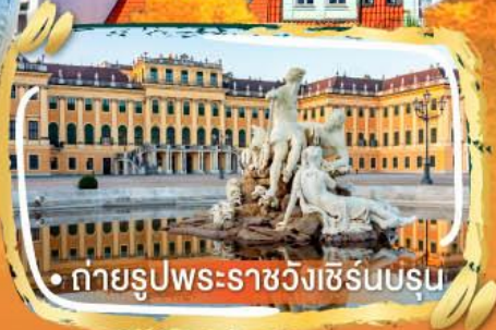
• ถ่ายรูปพระราชวังเซิร์นบรุน