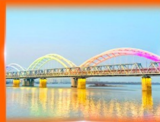
สะพานรถไฟฮาร์บิน