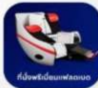
ที่นั่งพริ้นแบบฟลอปเบด