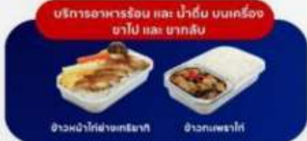
บริการอาหารร้อน และ น้ำดื่ม บนเครื่อง ขาไป และ ขากลับ