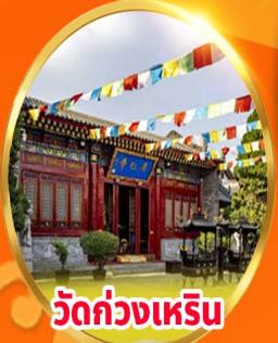
วัดกวางเหริน