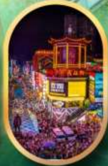
ถนนคนเดินซิงสือ