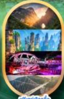
ฟรีคีย์เลือกซื้อ Option เสริม