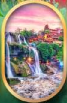
ฟูหลงเจินน้ำตก