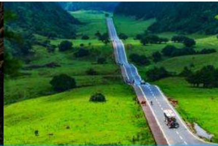
อุทยานเขาเนวฟ้า