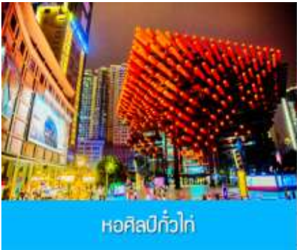
หอศิลป์กั๋วไท่