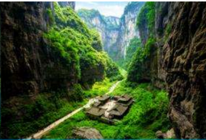
สะพานธรรมชาติสามแห่ง