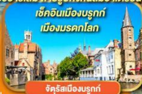
จตุรัสเมืองบรูจ